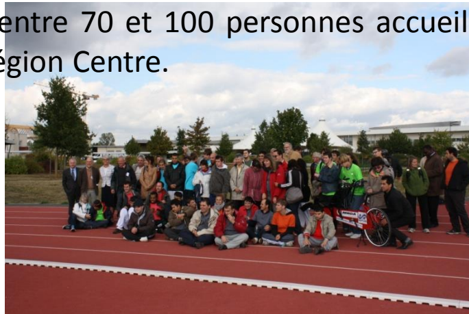
Autis'sport 2012 au CREPS de Bourges